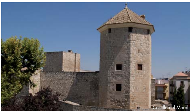
Castillo del Moral