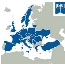
Itinerario Europeo del Patrimonio Judío