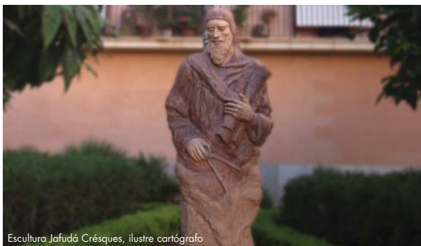
Escultura Jafudá Crésques, ilustre cartógrafo

Capital de las Islas Baleares, escuela secular de navegación y referencia de la cultura mediterránea a lo largo de los siglos, Palma es una de las ciudades de España donde la presencia del colectivo judío tiene una datación más antigua. Con una historia que se remonta al siglo V, la época más esplendorosa de los judíos mallorquines se sitúa a mediados del siglo XIV. Actualmente, son muchas las familias y personas que se reconocen como descendientes de la comunidad hebraica y se han constituido varias asociaciones privadas que, con la ayuda de las instituciones públicas de la isla, trabajan para que la historia, el legado y la memoria de los judíos mallorquines no se pierdan.