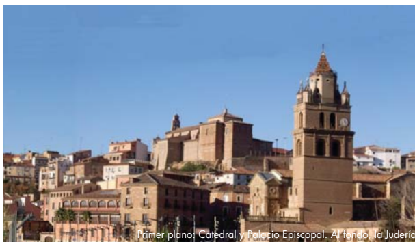
Primer plano: Catedral y Palacio Episcopal. Al fondo, la Judería

La presencia de judíos en Calahorra se atestigua documentalmente por primera vez en el s. XI. Alcanzó su mayor esplendor en los siglos XII y XIII, llegando a ser la más importante de la Rioja y casi del norte de España, con un centenar de familias en 1332. Se asentaron en la parte alta de la ciudad, en el lugar que actualmente ocupa el Rasillo de San Francisco. Allí se ubicó la Sinagoga, hoy desaparecida, aunque el callejero de la ciudad a comienzos del s. XX, todavía mantenía el "callejón de la Sinagoga".