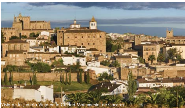
Vista de la Judería Vieja en la Ciudad Monumental de Cáceres

La belleza y el tipismo de la judería de Cáceres, Ciudad Patrimonio de la Humanidad, con sus calles estrechas, sus casas encaladas y luminosas, sus flores que alegran las ventanas y balcones, sólo es comparable con la nobleza monumental de esta ciudad milenaria. Te encantarán sus dos juderías: la "Judería Vieja", dentro de la Ciudad Monumental Amurallada, donde se encuentra la Ermita de San Antonio, antigua sinagoga judía; y la "Judería Nueva" en las actuales calles Paneras y de la Cruz, junto a la Plaza Mayor, donde ocupa lugar preferente el Palacio de la Isla, actual Archivo Histórico Municipal, que conserva restos de la antigua sinagoga.