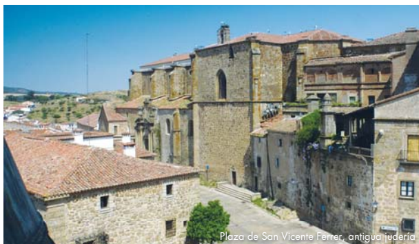
Plaza de San Vicente Ferrer, antigua judería

En la zona del Parador Turismo se instala una comunidad judía durante la reconquista cristiana de Alfonso VIII. Próxima a las caballerizas del palacio de Mirabel, se construye la Sinagoga, la más antigua y espaciosa de la alta Extremadura medieval.