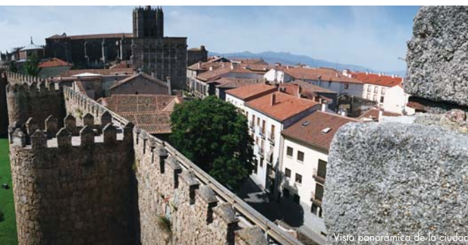
Vista panorámica de la ciudad