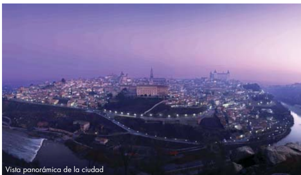
Vista panorámica de la ciudad

Capital de Sefarad. Jerusalén de Occidente. Impresionante fortaleza natural, rodeada de murallas y por el río Tajo, se encuentra tan sólo a 70 km de la capital de España. La presencia judía en Toledo se confirma desde el período visigodo, y ya con los musulmanes fueron considerados “Hombres del Libro”, dotándoles de una gran libertad. Con Alfonso VI, bajo el dominio cristiano, su crecimiento y prosperidad material no cesó de aumentar. Desde el s.VIII la judería toledana se emplazaría en la parte sudoeste de la ciudad, intramuros. Contaba con cinco barrios claramente diferenciados, con más de diez sinagogas. Actualmente son visitables: Sinagoga de Santa María la Blanca o Sinagoga Nueva de Yosef ben Shoshán, y Sinagoga del Tránsito, Museo Sefardí o de Semuel ha-Leví.