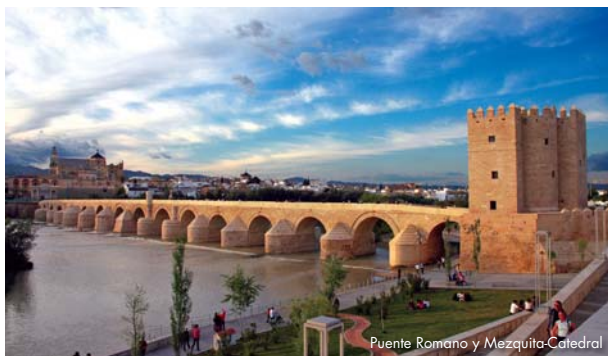
Puente Romano y Mezquita-Catedral

Bajo el Emirato, primero y el Califato Omeya, después comienza la gran época de los judíos españoles, que alcanzan en Córdoba durante los siglos X y XI su edad de oro, consiguiendo las mayores cotas de bienestar y nivel cultural. En estos siglos hay en Córdoba judíos que son ministros de los monarcas musulmanes, como Hasday ibn Shaprut, o sabios y filósofos de la importancia de Moisés Ben Maimón, Maimónides, con el que el pensamiento judío de todos los tiempos llega a su cima. El centro religioso y cultural del judaísmo se asienta en Córdoba, con las academias rabínicas de Córdoba y Lucena. Se conserva una magnífica Judería incluida en la zona designada "Patrimonio de la Humanidad" por la UNESCO.