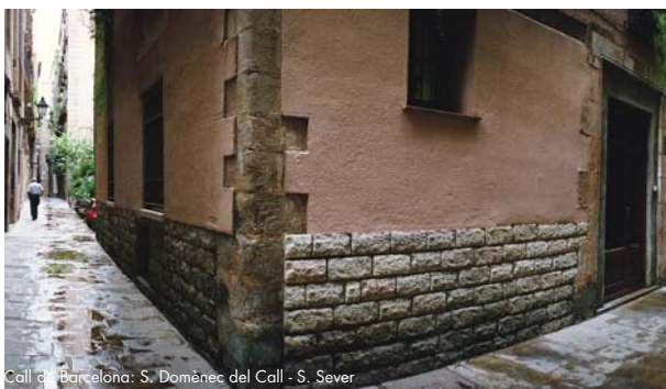
Call de Barcelona: S. Domènec del Call - S. Sever

La presencia de judíos en Barcelona está documentada desde antes de la existencia del barrio judío en la ciudad, aunque se desconoce si ya constituían una comunidad.