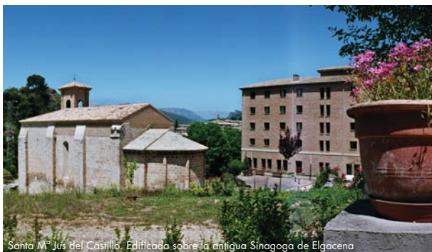
Santa Mª Jus del Castillo. Edificada sobre la antigua Sinagoga de Elgacena

La ciudad de Estella-Lizarra posee un rico pasado judío que se remonta al momento de su fundación en el último cuarto del siglo XI. A lo largo de su historia contó con dos aljamas, la más antigua fue conocida como “Elgacena” y ocupaba los terrenos más próximos al Castillo Mayor, y consta que para el año 1135 ya estaba abandonada. La segunda, conocida como “Judería Nueva”, acogió una importante comunidad judía y parte de sus restos, aún visibles hoy en día, se localizan en una terraza sobre el río Ega bajo la fortaleza de Belmecher y sobre la entrada del Camino de Santiago. Esta judería nueva sufrió un ataque vandálico el 6 de marzo de 1328, conocido como la “Matanza de los Judíos de Estella”, en esa fecha fueron saqueadas e incendiadas numerosas viviendas e incluso llegaron a degollar a un buen número de vecinos judíos.