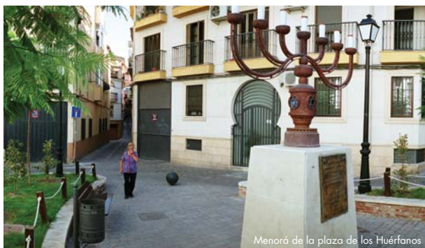
Menorá de la plaza de los Huérfanos

La presencia de judíos en Jaén se remonta al año 612, aunque es posible que ésta fuera bastante anterior. La comunidad judía llegó a suponer alrededor del diez por ciento de la población de la ciudad durante los siglos medievales y, a pesar de que tras la conversión forzosa al cristianismo y subsiguiente expulsión, la judería fue convertida en el "Barrio de Santa Cruz", la presencia de "judaizantes" continuó siendo tan importante que dio lugar a la creación en la misma del tercer Tribunal de la Inquisición en 1483, realizándose procesos inquisitoriales contra jienenses hasta bien entrado el siglo XVIII. El legado judío de Jaén no se limita a la Judería, sino que puede verse en sus leyendas, tradiciones, gastronomía y noticias históricas. Asimismo, Jaén fue la cuna de Hasday ibn Shaprut, médico, consejero y diplomático durante el mandato de los califas Abderramán III y Alhakan II, figura que para los historiadores supone el inicio de la "Edad de Oro de los Judíos Españoles", durante la mítica España de las Tres Culturas.