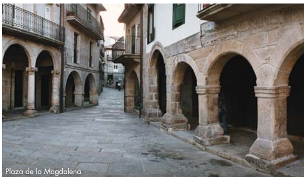
Plaza de la Magdalena

En la edad media, la villa de Ribadavia fue una localidad rica en el marco de una comarca próspera. El asentamiento de la nobleza laica y eclesiástica de Galicia y norte de España propició la consolidación de una comunidad judía importante que administraba y gestionaba los bienes de los señores.