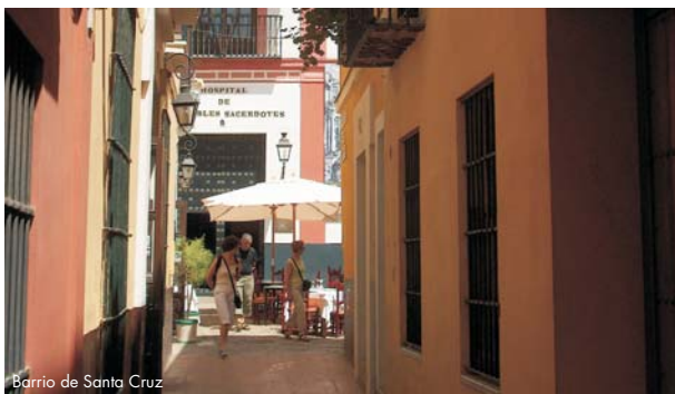
Barrio de Santa Cruz

Santa Cruz es el nombre con el que en la actualidad se denomina una parte de la antigua judería. No existe constancia que aquella zona estuviera ocupada por judíos desde la etapa musulmana de la ciudad aunque existe una tradición que nos dice que cuando la ciudad fue conquistada por Castilla en 1248, al rey Fernando III los almohades le entregaron la llave de la ciudad y los judíos la de la Judería. Aunque no es más que una tradición las dos llaves que se conservan en el Tesoro de la Catedral parecen confirmarlo. Lo que sí que es cierto es que una vez conquistada la ciudad todas las mezquitas fueron entregadas a la iglesia excepto tres que se concedieron a los judíos.