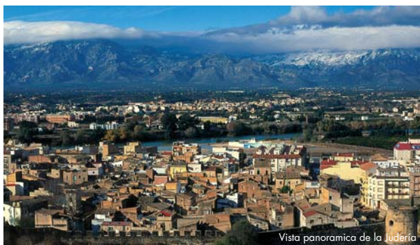
Vista panorámica de la Judería

Tortosa, capital del Baix Ebre, es una ciudad fuertemente amurallada, con claros vestigios de un pasado rico, tanto en la etapa romana como en la árabe y medieval. El castillo de La Suda domina la ciudad y nos ofrece una espléndida visión de conjunto. En el núcleo antiguo se suceden los vestigios de otras épocas y culturas. Del conjunto monumental destaca la Catedral de santa María, el Palacio Episcopal o el trazado de la judería. Tras la conquista de la Turtuxa islámica, en 1148, Ramon Berenguer IV donó las antiguas atarazanas árabes a la comunidad judía; nace así el llamado call vell. Ésta es la primera noticia de la existencia de un barrio habitado exclusivamente por judíos en Tortosa, aunque su presencia en la ciudad esté documentada desde el siglo VI gracias a la datación de la reconocida lápida trilingüe, hoy visitable en la Exposición permanente de la Catedral. A principios del siglo XIII, se construye la judería nueva. Ambas han conservado prácticamente intacta la estructura laberíntica de sus calles y algunos topónimos.