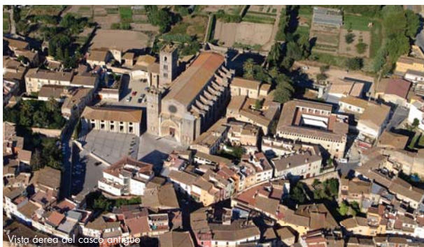
Vista aérea del casco antiguo

El primitivo call judío se gestó a principios del siglo XIII en el barrio del Puig de l'Eramala , alrededor de la primera sinagoga. En 1238 y gracias a la concesión de un privilegio otorgado por el conde de Empúries a la comunidad judía, ésta inició una etapa de prosperidad, que fue decisiva para su expansión y crecimiento hacia el barrio del Puig Mercadal , en aquel momento centro comercial y artesanal y lugar de residencia de la familia condal. Allí se construyó en 1284 una nueva sinagoga, ampliada y rehabilitada en 1321. Todavía hoy se conserva el edificio convertido en vivienda particular.