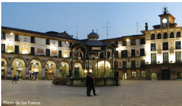
Plaza de los Fueros

Los primeros datos de la presencia de judíos en Tudela se remontan al s. IX y se sitúan en un principio en la calle San Julián (principal calle de la Judería Vetula). En 1170 Sancho VI El Sabio los trasladará al abrigo del Castillo, en el Cerro de Santa Bárbara (Judería Nueva). Con su Catedral cristiana de corazón judío y musulmán; con su ciudad vieja encajada entre una morería y dos juderías; con sus grandes personajes hebreos de fama y renombre mundial como Benjamin de Tudela, Tudela es una singular ciudad en la que convivieron las tres culturas en pleno corazón del reino de Navarra. La Judería Vieja y la Judería Nueva, con un camino intermedio salpicado de constantes evocaciones del tiempo en que los hebreos poblaron la ciudad, constituyen hoy un itinerario sorprendente que permite conocer una buena parte de la ciudad histórica.